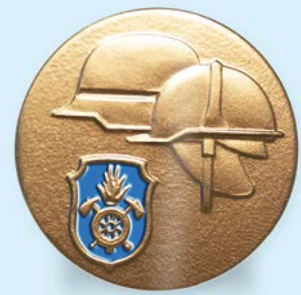
STUFE IV Gold-blau