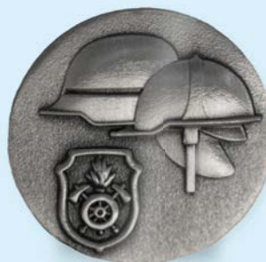
STUFE II Silber