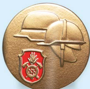
STUFE VI Gold-rot