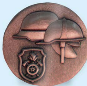
STUFE I Bronze