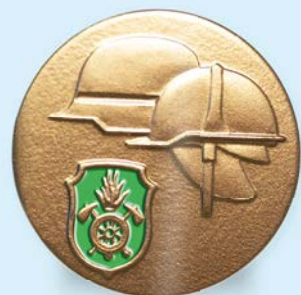
STUFE V Gold-grün