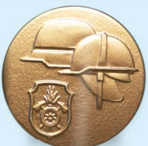
STUFE III Gold