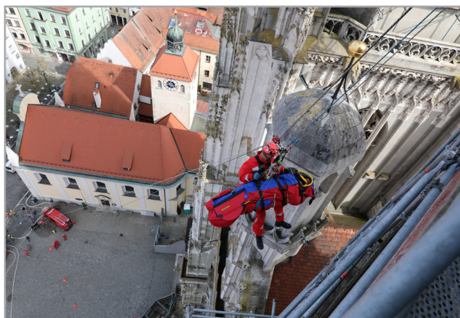
Der Patient wird mit einem Höhenretter über eine Seilbahn abgelassen.