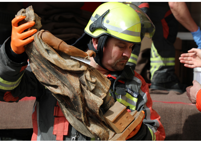
Vorsichtig und mit Schutzhandschuhen wird eine hölzerne Figur aus dem Gefahrenbereich gebracht.

tigen. Die tatkräftige Unterstützung durch eine schlagkräftige Freiwillige Feuerwehr, auch in Städten mit hauptberuflichen Feuerwehrleuten,