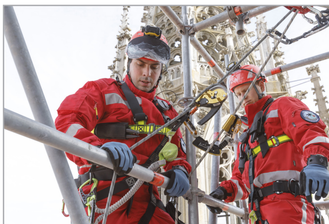
Die Höhenretter der Berufsfeuerwehr bereiten die Rettung des verletzten Arbeiters vor.